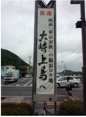
ドラマでも使われた離島・ホテルです♪ 有名人のサインが館内にあります♪