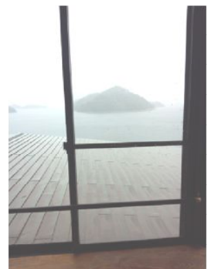
ホテルは広島県 目の前の離島は愛媛県