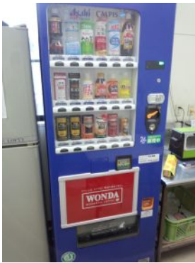
100円自販機、館内にあり♪