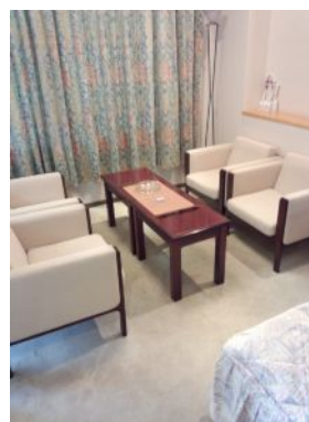
綺麗な客室もあります♪