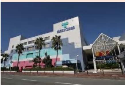
海沿いを徒歩30分 水族館