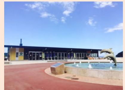
お洒落なお店でゆっくり一息