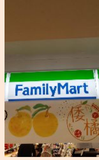
駅構内ファミリーマート