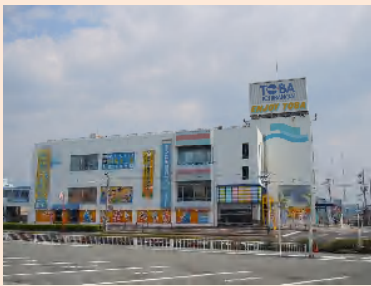
駅前ショッピングモール