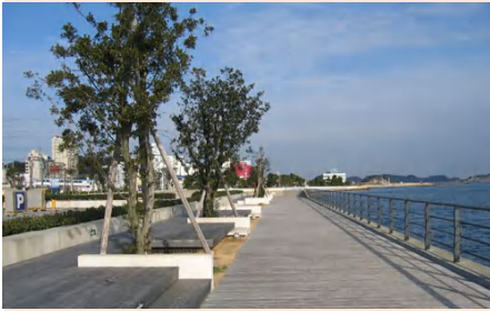
お休みの日は海岸沿いをお散歩