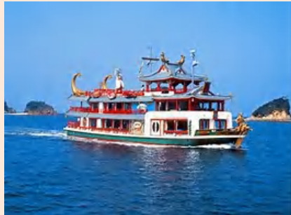
徒歩20分 遊覧船乗り場