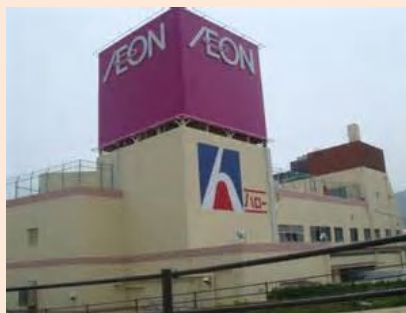
バスで15分でイオン♪