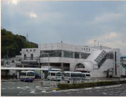
鳥羽駅～施設まで徒歩5分