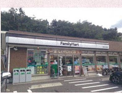
ファミマ(寮から徒歩10分)