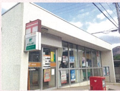
薬局の隣にある郵便局