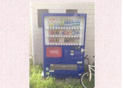
寮の横に自動販売機有ります