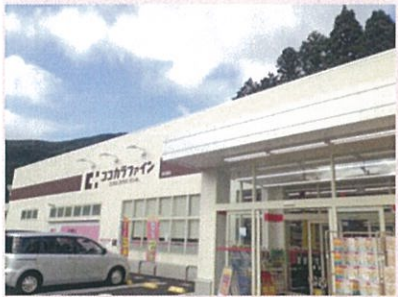
今年の6月にオープンした薬局