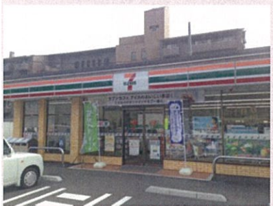
セブンイレブン(寮から徒歩5分)