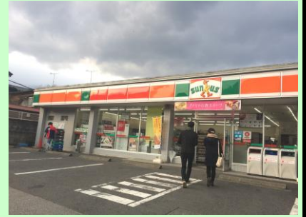
駅前にコンビニあり！