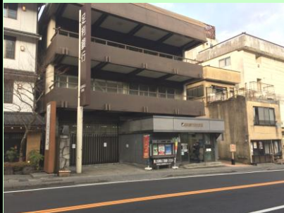
日光金谷ホテルから徒歩5分以内、銀行やコンビニあり♪