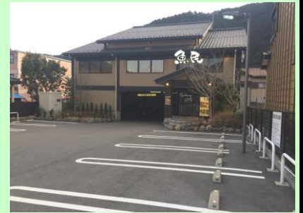
駅前は居酒屋もあり！