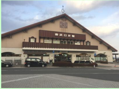
日光駅⇔東部日光駅、徒歩5分！2駅利用できます♪