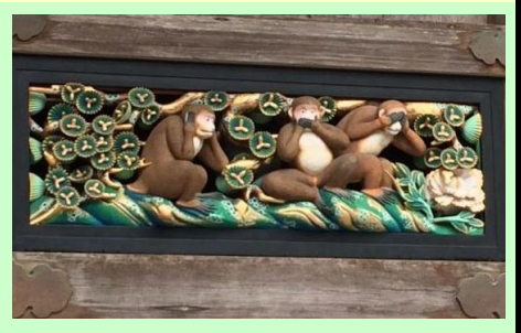
日光東照宮、中禅寺湖などなど、世界遺産「日光」を楽しめます♪