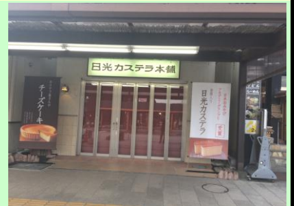
休日は駅まで行って買い物や美味しいものを楽しみましょう♪