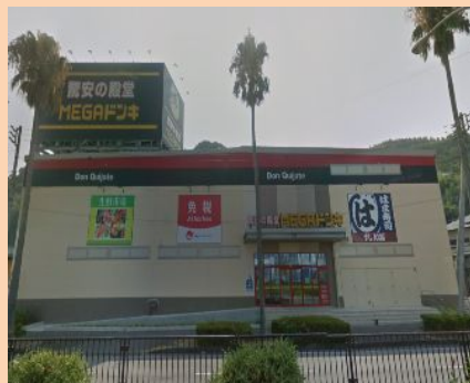
最強のドンキホーテ