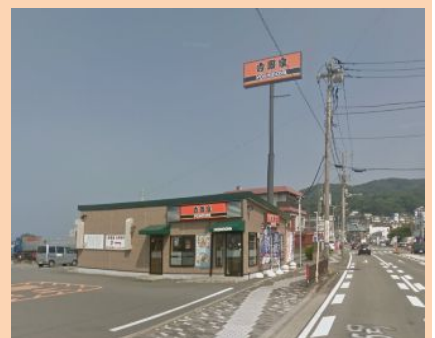
みんな大好きな吉野家