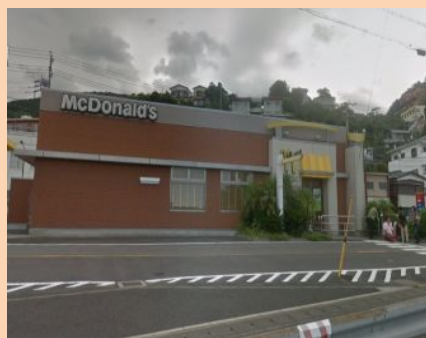
みんな大好きなマック