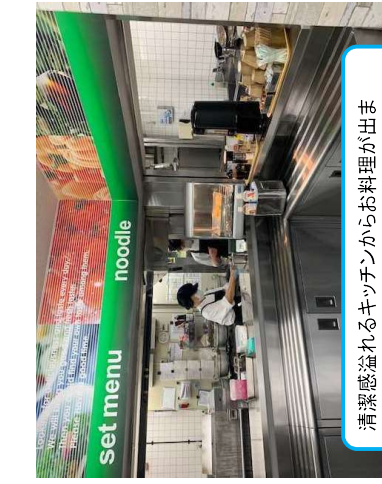
清潔感溢れるキッチンからお料理が出来ます！